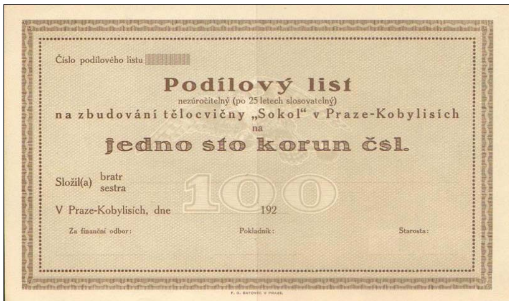
A2215 – Dluhopis Tělocvičné jednoty „Sokol“ Praha-Kobylisy na 100 Kč, tisk F. B. Batovec v Praze.

získání kvalitních informací z dlouhá léta nepřístupných archivních fondů a tak po jejich důkladném prostudování se zrychlí příprava kompletních soupisů i pro další díly. Jejich vydání pak bude jen otázkou dostatečných finančních prostředků pro zajištění jejich výroby a distribuce. To sice není nejsnadnější, ale věříme, že právě ono důležité a zásadní zpracování nových informací povede k zájmu nejen čtenářů, ale i případných sponzorů do jednotlivých oborových dílů, které tak budou prvním katalogem svého druhu u nás, ale i v celosvětovém měřítku oboru skripofilie.