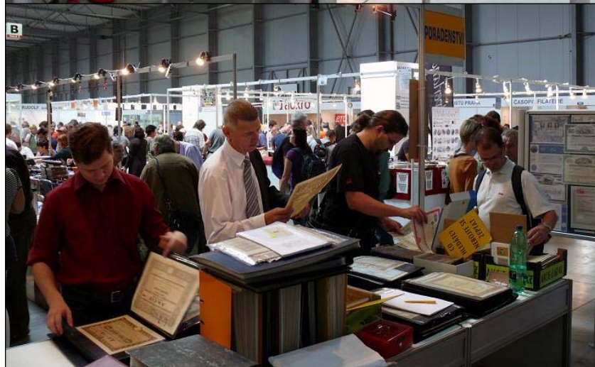
Letošní stánek MCP na veletrhu Sběratel s připojenou výstavou automobilových akcí