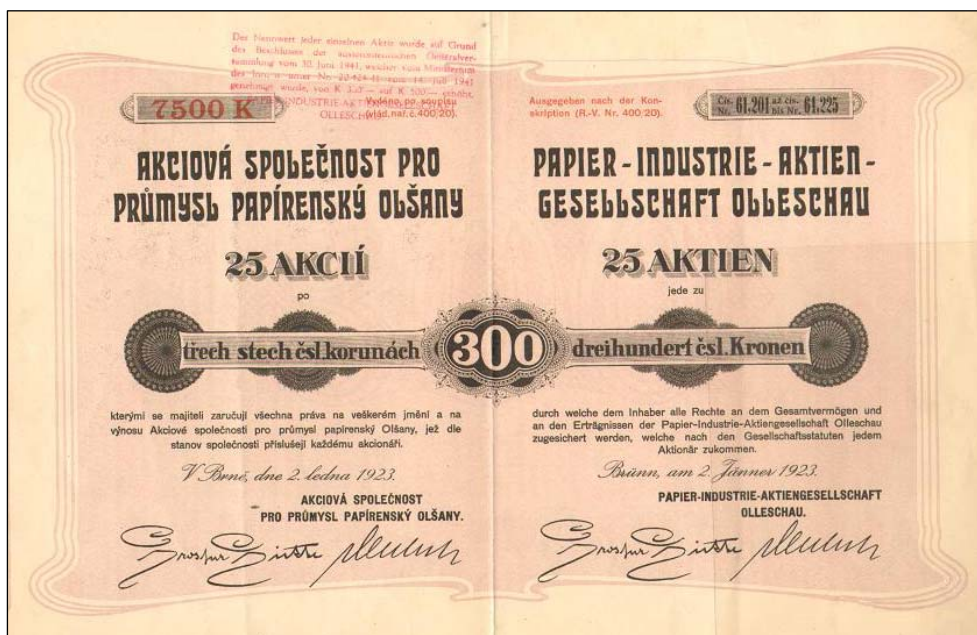
A2221 – Akcie Akciové společnosti pro průmysl papírenský Olšany na 25x 300 Kč vydaná 2.1.1923, tiskárna neuvedena.

Jak vidět, stále je co objevovat a obdivovat a jistě i v dalším období Vám představíme nové a zajímavé objevy jak z archivů tak i přírůstky do našich sbírek.