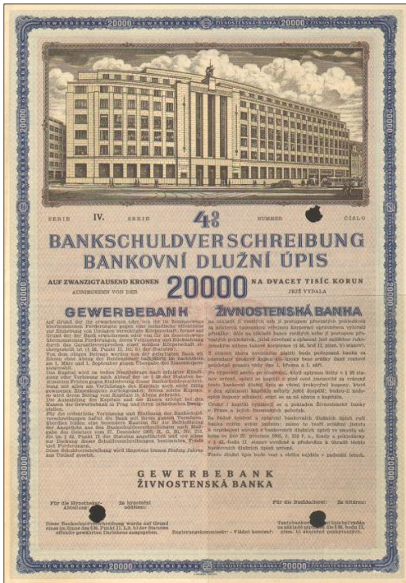
A2228 – Dluhopis Živnostenské banky na 20.000 K emise 1940, tisk V. Neubert.

V tomto ohledu se jedná o, jak se říká, pole neorané a počet i škála podobných cenných papírů ještě není zralá na dokonalé zmapování formou vydaného katalogu. Koneckonců vydání dalších dílů se poněkud opožďuje, ale je to jen ku prospěchu věci a můžeme Vám sdělit, že např. připravovaný díl Hotelů a lázní, který obsahuje i různá koupaliště, sanatoria, ale i rozličné restaurační podniky se právě díky odkladu podařilo doplnit nejen o faktografii, ale postupem času i o velmi unikátní fotografie oněch míst a objektů. Hlavním důvodem odkladu byla však zejména možnost